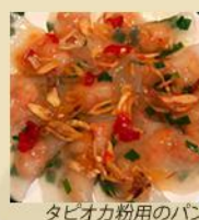
タビオカ粉用のパン