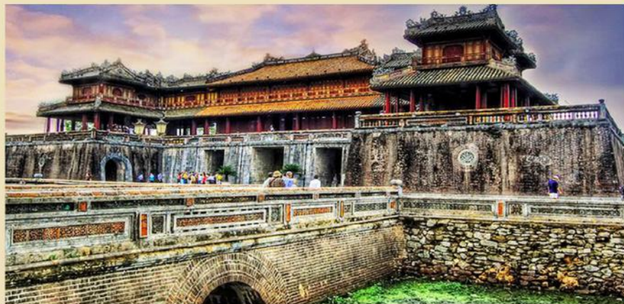
Kinh thành Huế

Thừa Thiên Huế là một tỉnh nằm ở vùng duyên hải Bắc Trung Bộ của Việt Nam. Phía Nam giáp với Đà Nẵng, phía Bắc giáp với tỉnh Quảng Trị.