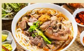
Bún Bò Huế